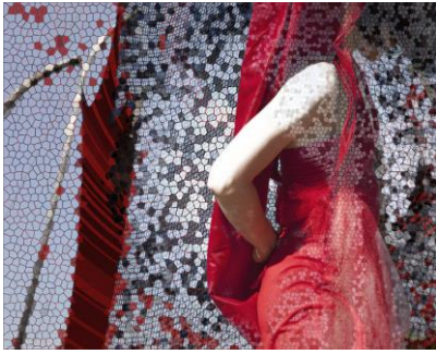
Sans titre 2014