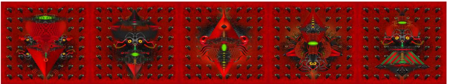
Krasidimitch, 5 vérités habillées de mensonges tapageurs, 5 peintures numériques sur aluminium, 80"x16", 2019