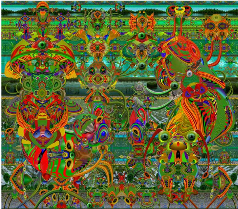
Krasi Dimtch, Machines réalisant des vœux offrent des rêves supérieurs Peinture numérique sur plexiglas acrylique, 40"x36", 2017