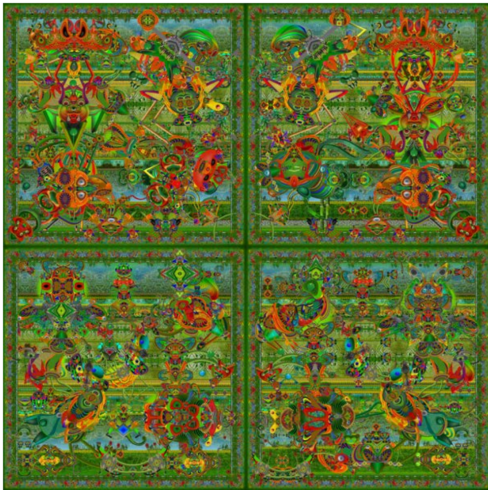
Krasi Dimtch, Les jardins des délices numériques, 4 peintures numériques sur plexiglas acrylique, 72" x 72", 2017