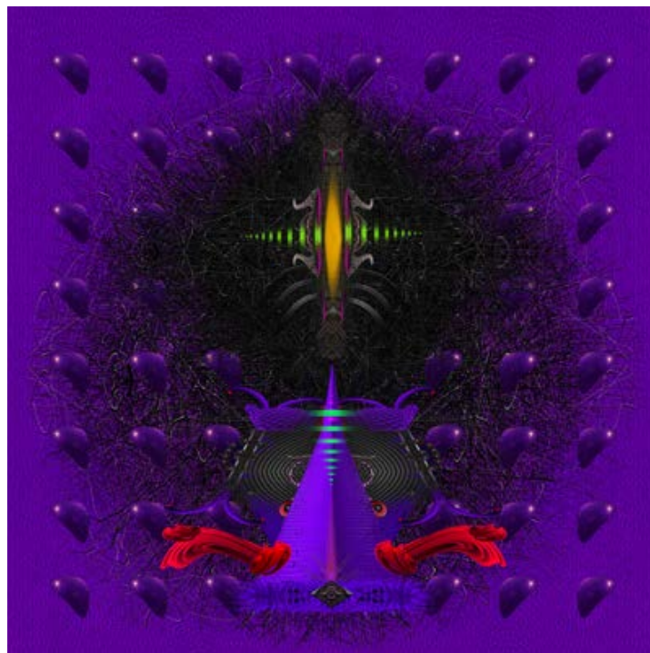
Krasidimitch, L'espoir rêve en violet, peinture numérique sur aluminium, . 28"x28, 2019