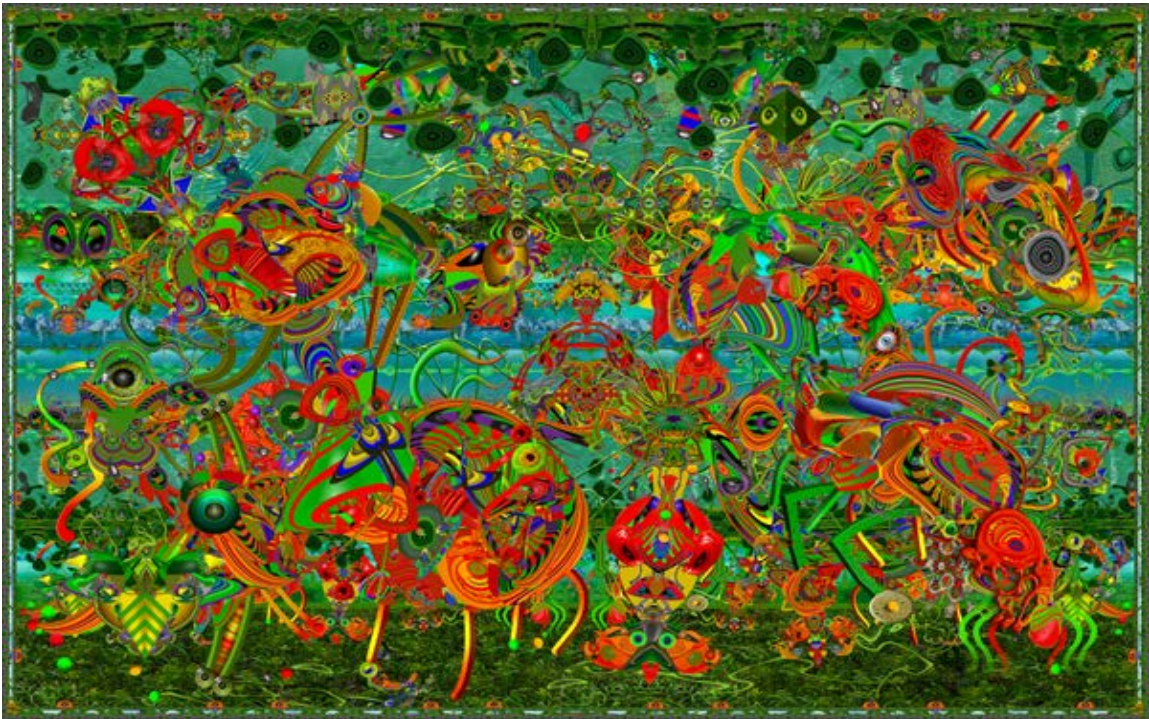
Krasi Dimtch, L'ego - le passé = la liberté, peinture numérique sur aluminium, 24"x36", 2019