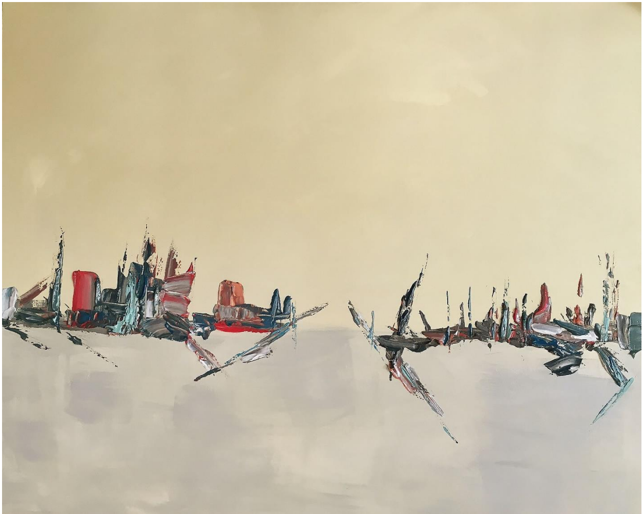
Solitudes suspendues (acrylique sur toile, 101.6 x 152.4 x 3.81) 2016

Je raconte des histoires voilées et influencées par ma vision positive. Cette signature traverse rapidement plusieurs séries et évolue parfois brusquement mais retient son intégrité. L'exposition présente une sélection d'œuvres créées au cours des quatre dernières années.