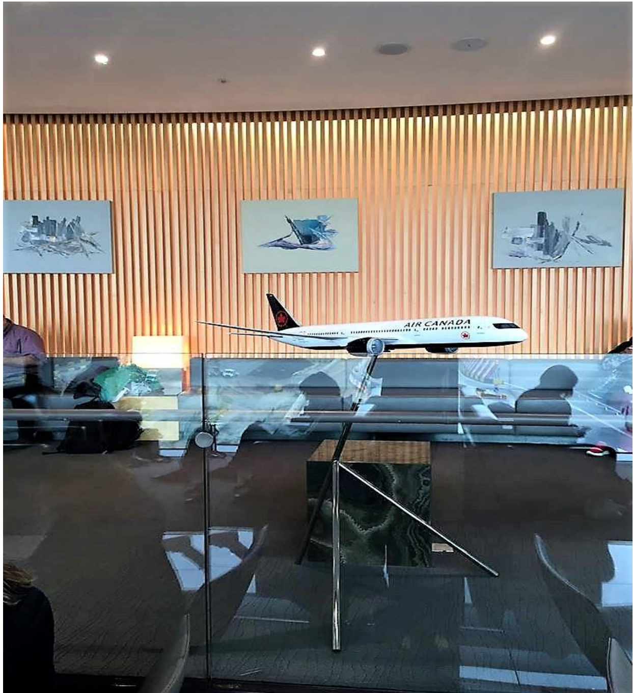
Salon Feuille d'érable d'Air Canada, Heathrow, Angleterre, avril 2019

Expo solo à Heathrow : Exposition organisée et préparée de huit tableaux (tous de 76.2 x 101.6 x 3.81 cm) de ma série En équilibre - salon Feuille d'Érable d'Air Canada à Heathrow, Angleterre (durée : 2019 é 2014)