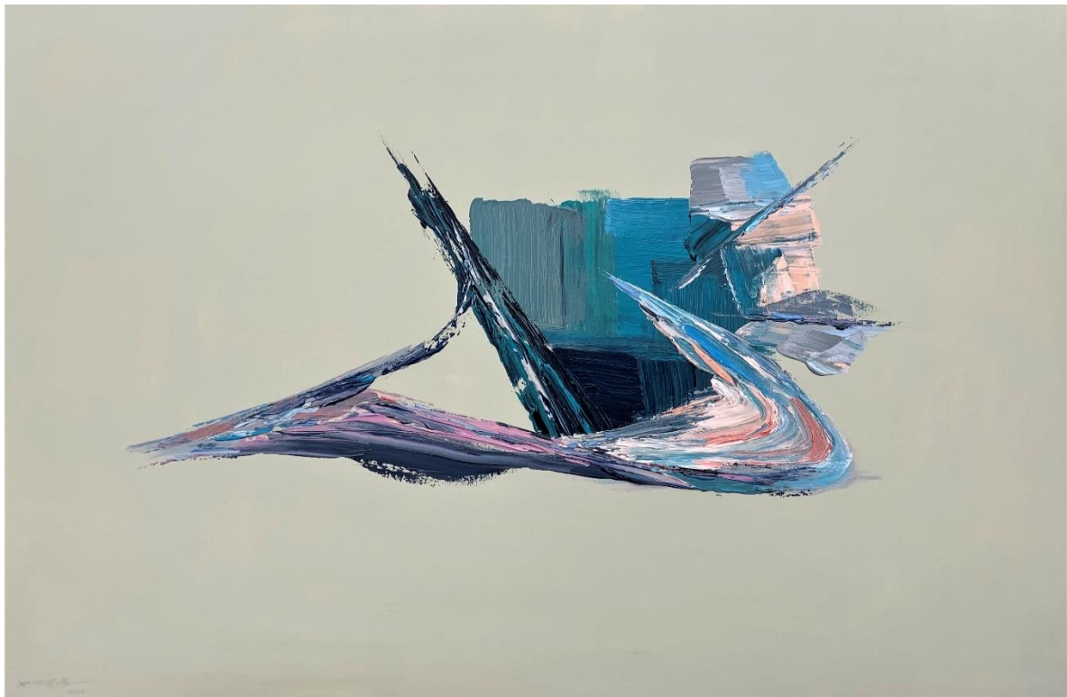
En équilibre4.1(acrylique sur toile, 76.2 x 101.6 x 3.81 cm) 2019