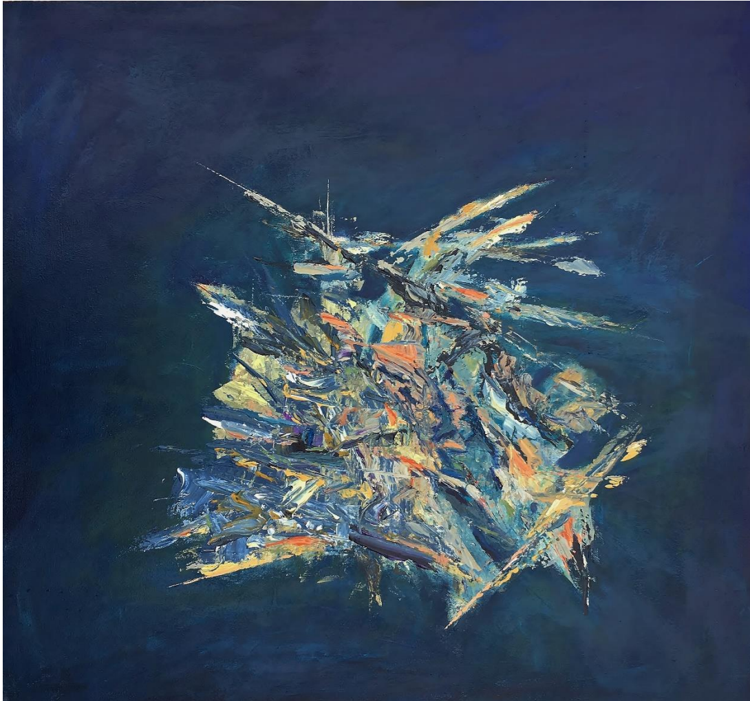
En équilibre16, (acrylique sur toile, 101.6 x 101.6 x 3.81