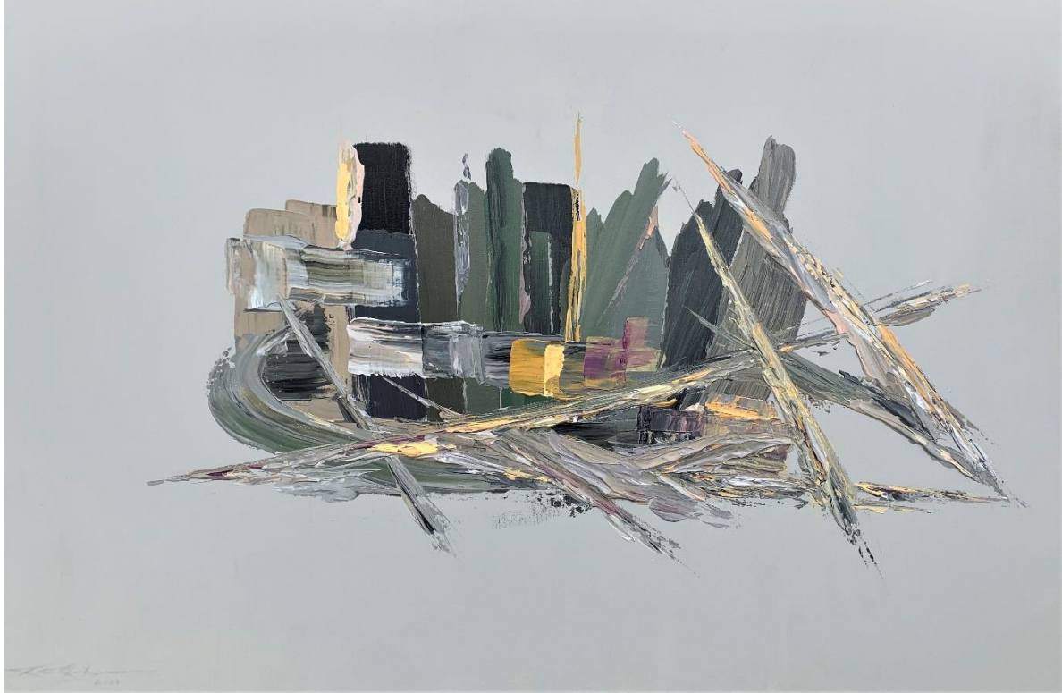
En équilibre17 (acrylique sur toile, 76.2 x 101.6 x 3.81 cm) 2019